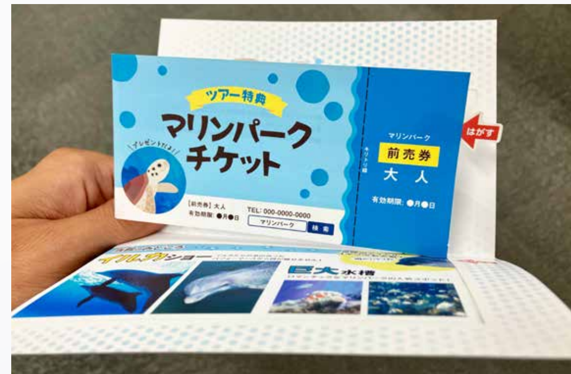
ポップアップカード