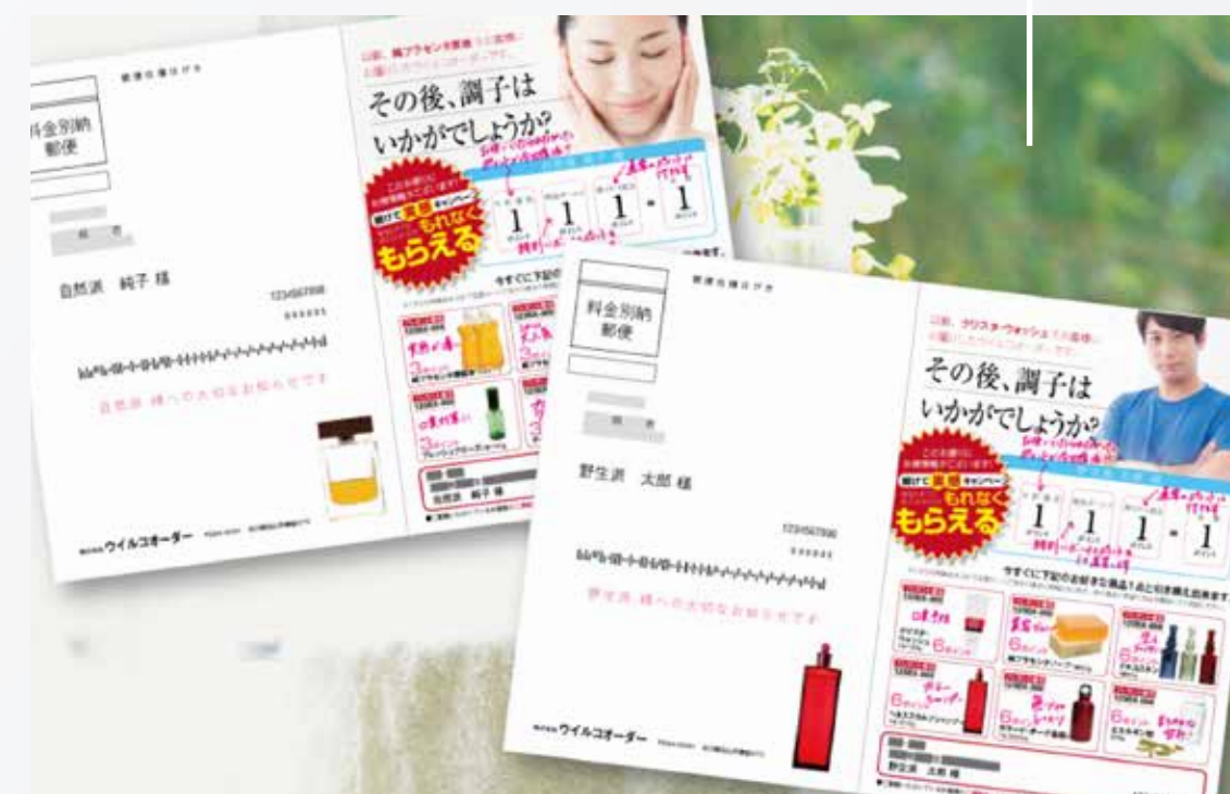
パーソナライズ印刷