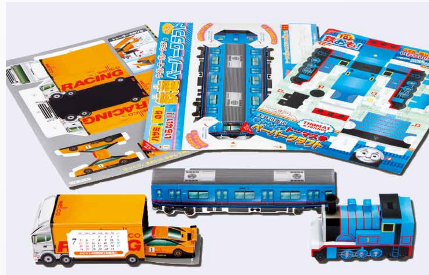
魔法のペーパークラフト®