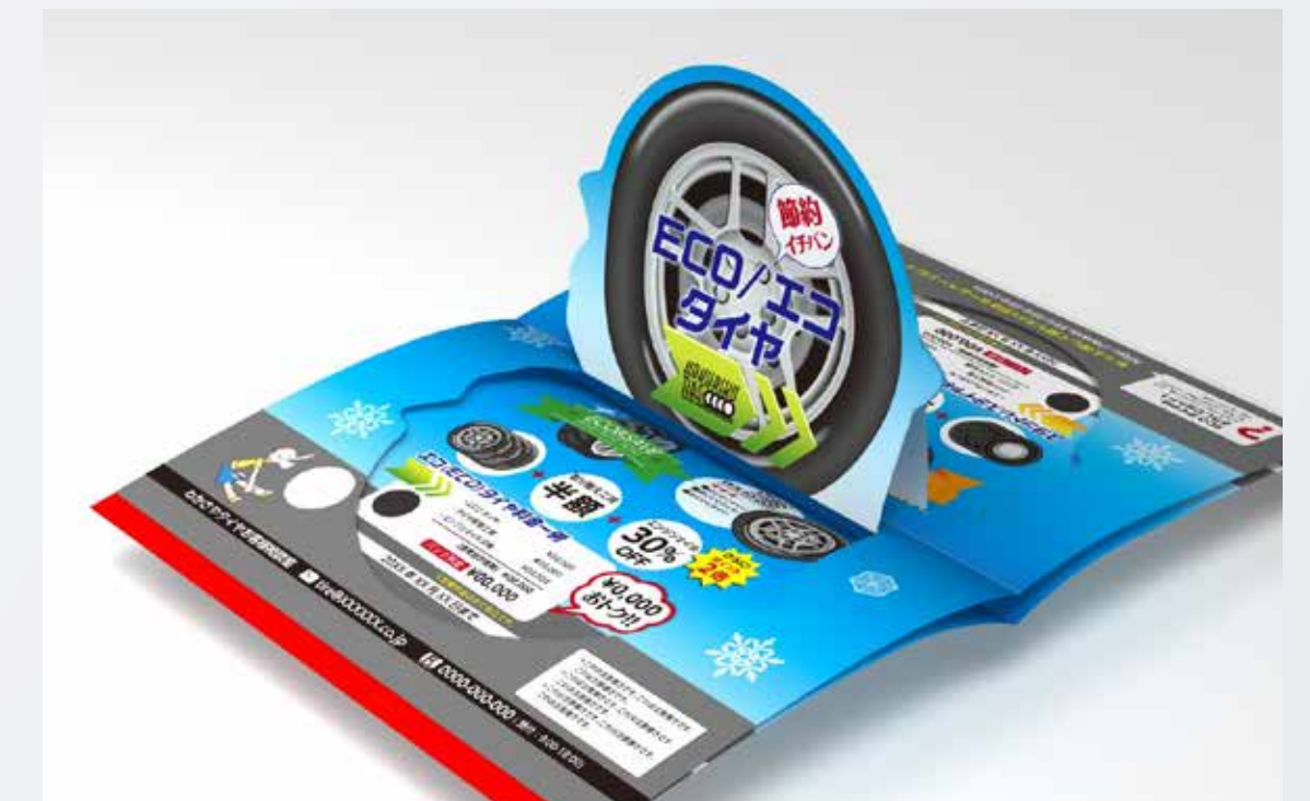
スタンドポップアップ