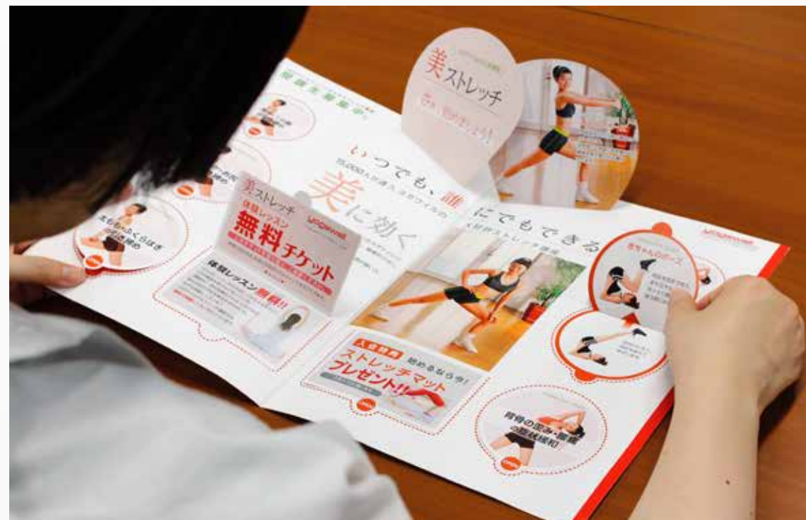
ポップアップリーフレット