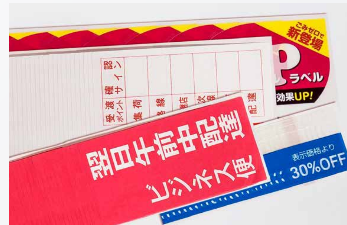
ごみゼロラベル（ずらし積層）