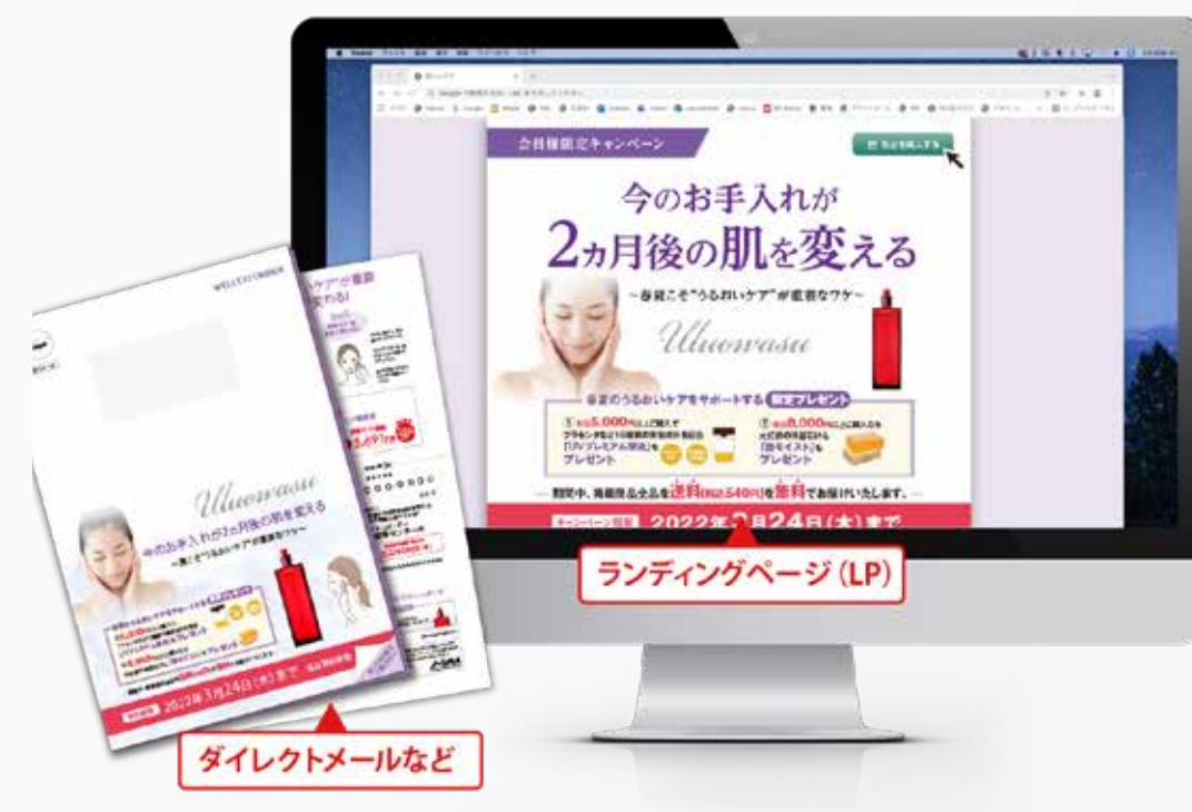
紙面から Web 制作サポート