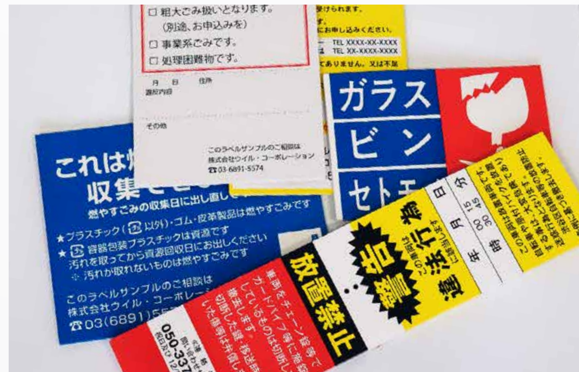
ごみゼロラベル（ブロック積層）