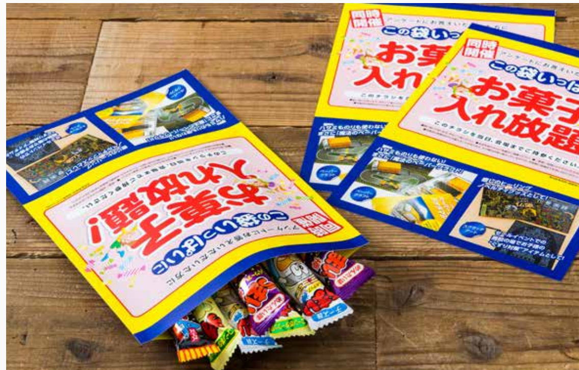
カンガルーチラシ (詰め放題袋)