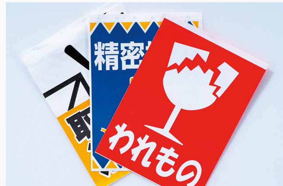
ごみゼロラベル（セパレート）