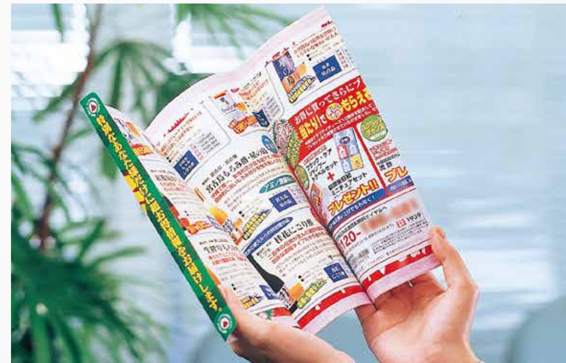
レスポン君 (封筒一体型 DM)