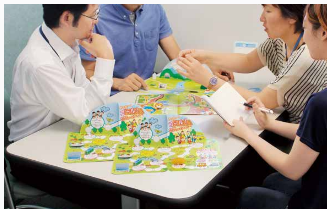
クリエイティブ企画 / デザイン制作