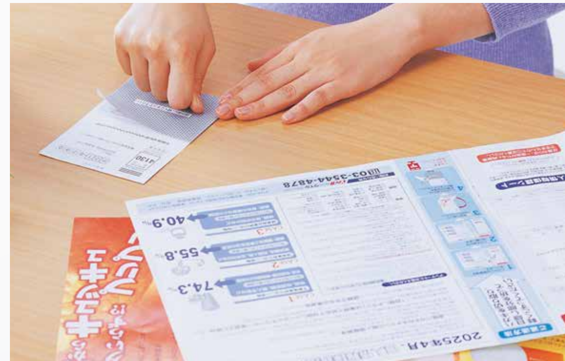
プライバシー保護はがき付きチラシ