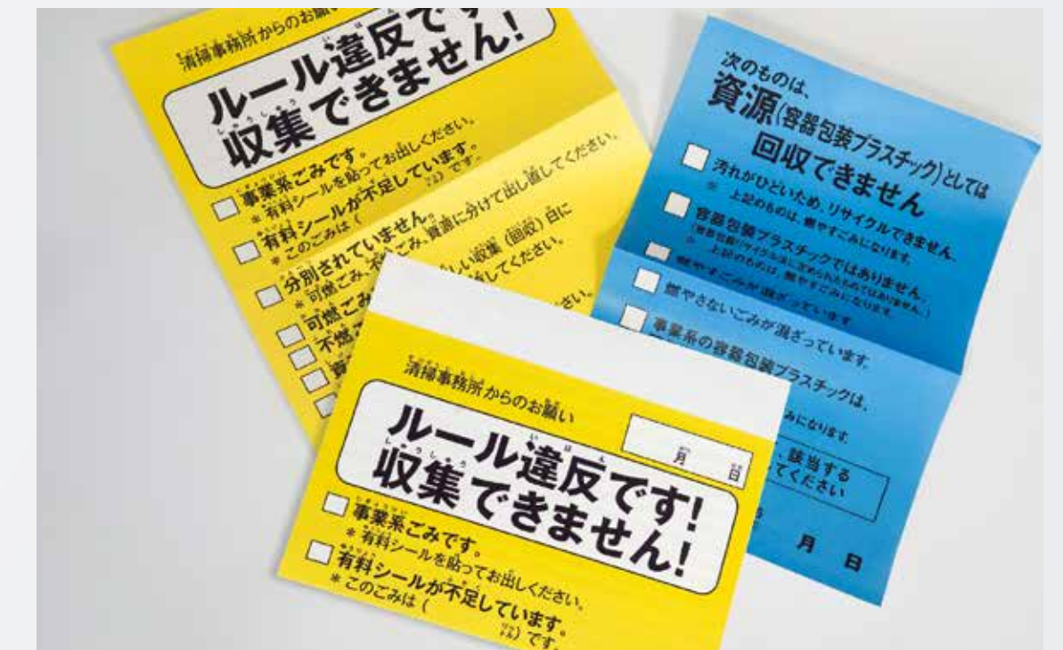
ごみゼロラベル（パノラマ）